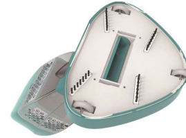
Large suction door and scrubbing brushes Une entrée d'eau de grande aspiration et des brosses