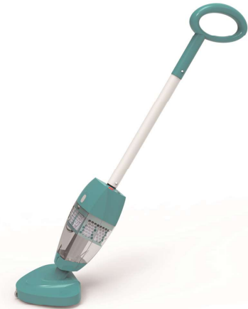
Telescopic handle Manche télescopique