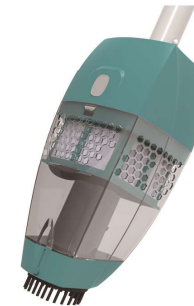
Large container and removable brush head Grande capacité de rétention et tête d'aspiration démontable