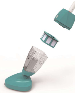
Simple structure Structure simple