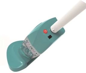
Easy button Interrupteur facile